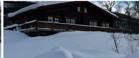
Lägenheterna 6 och 7