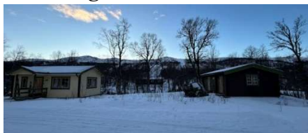
Lägenheten 1 och förråd