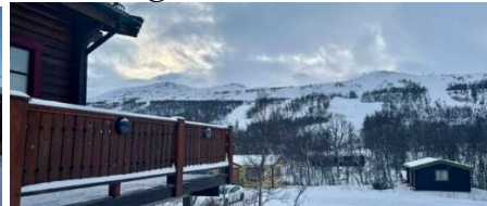
Vyn från lägenheter 6 och 7