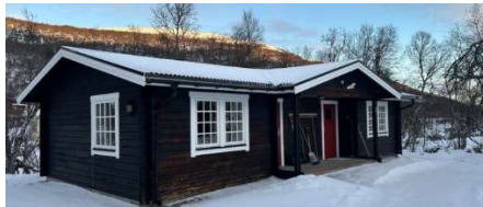
Lägenheterna 4 och 5